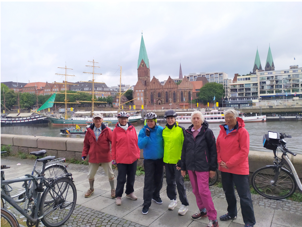
Die Radfahrer an der Weserpromenade mit dem Dom (r.) im Hintergrund.