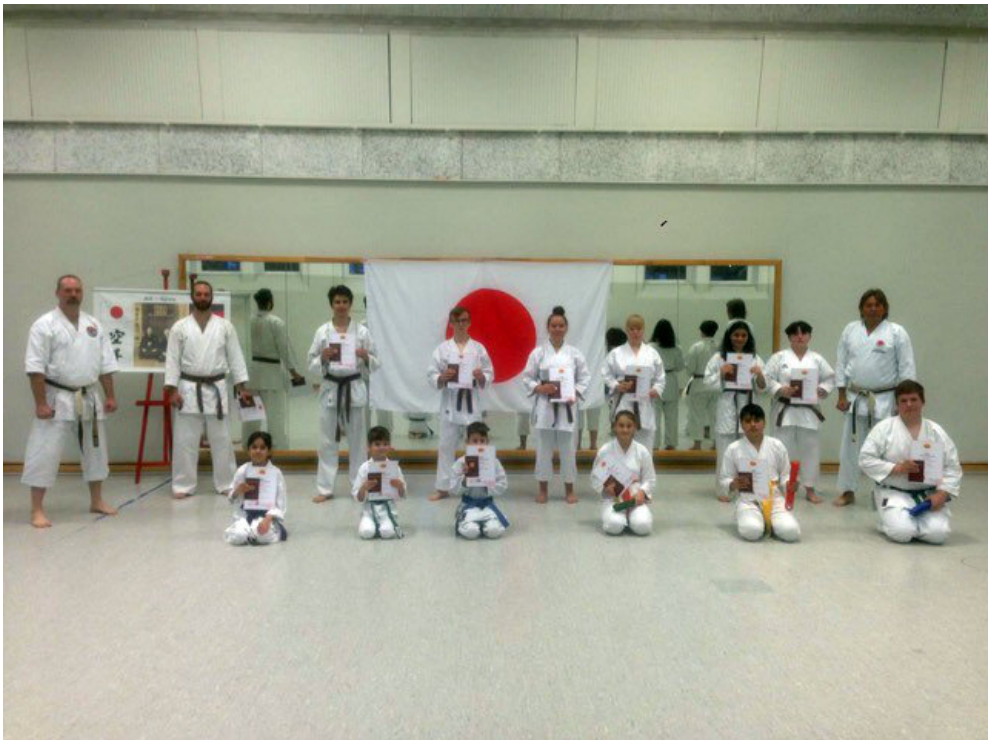
Gerade neun Jahre alt und schon mit einem Braungurt unterwegs.