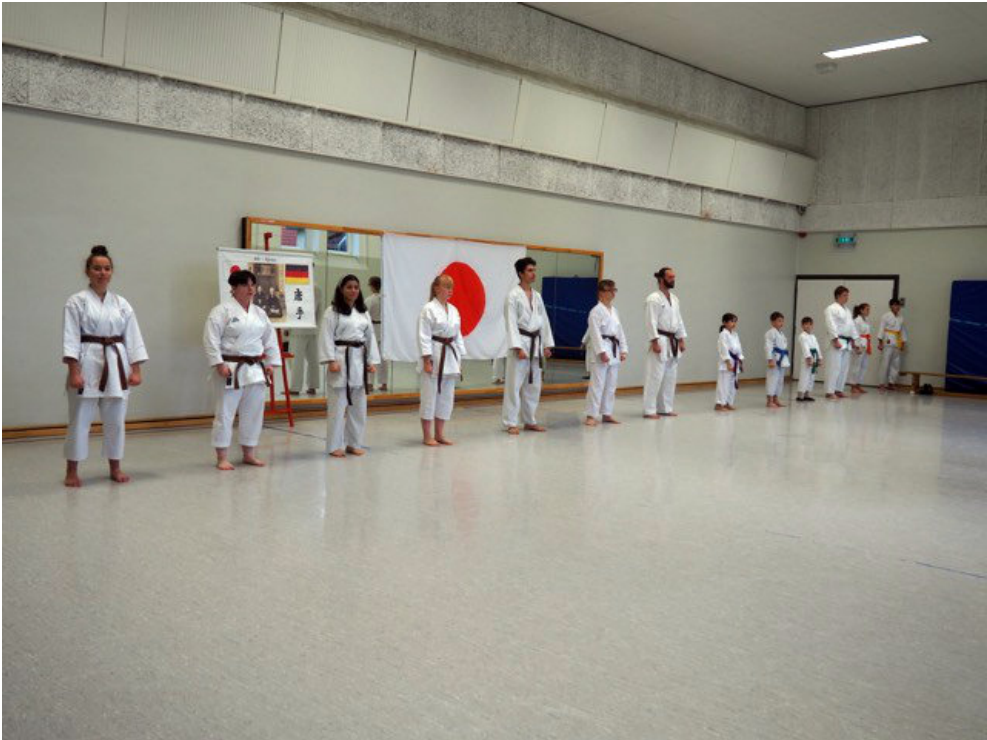
Schon bei der Angrüßung wird auf den Abstand geachtet