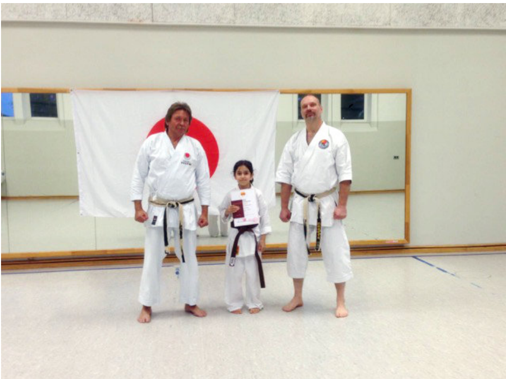
Die stolzen Prüflinge mit ihren neuen Güiteln.