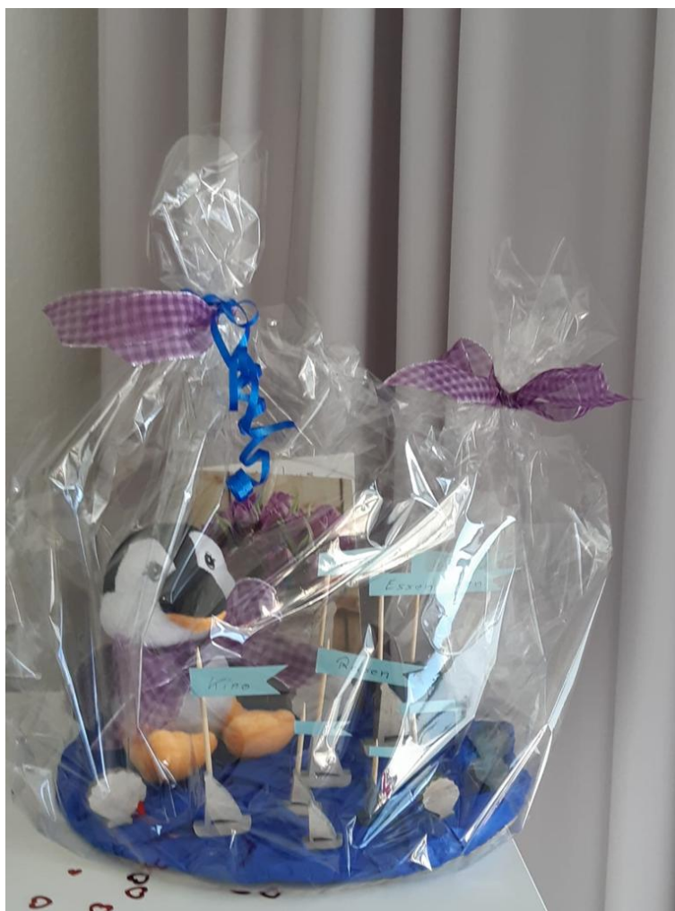
Der süße Pinguin bringt tolle Geschenke